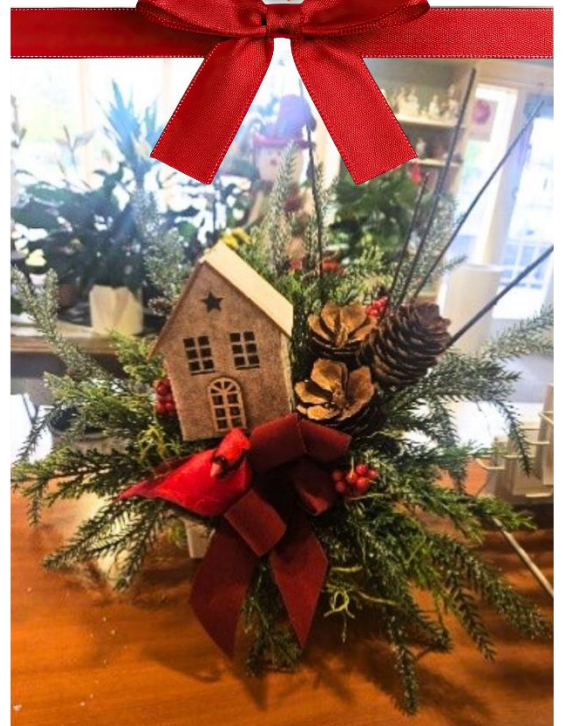
Exemple de centre de table. Autres modèles possibles à réaliser.

Il est possible d'apporter votre contenant et les autres accessoires que vous voulez ajouter. De plus, vous pourrez obtenir d'autres accessoires, payables en argent comptant (entre 5 et 15 $ par article).